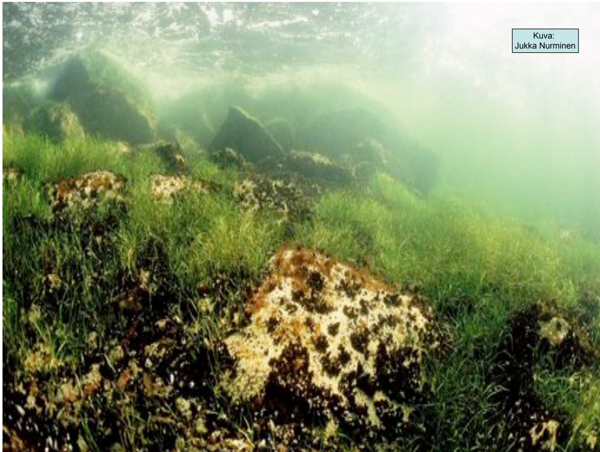
Kuva: Jukka Nurminen